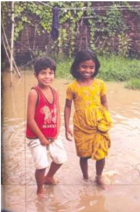
Os estudantes têm beneficiado do trabalho de muitos voluntários que ajudam o Dhaka Project.